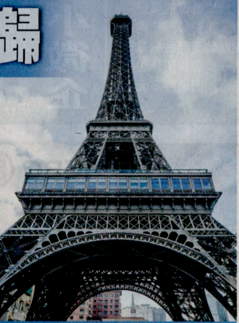
振耀建築憑巴黎鐵塔工程首獲金沙卓越供應商獎項

楊：振耀在建築工程上有豐富經驗，特別對金屬屋頂工程有獨到的見解及技術。在不影響正常營運前提下，振耀完成了約一萬五千平方米的澳門威尼斯人金光會展金屬屋頂修繕置換工程，且放棄一直沿用的進口材料，改用由澳門本地公司設計及生產、具備防水、抵禦颶風吹襲等功能，達到國際質量水準的建築材料。該工程於去年完工，振耀再次獲金沙中國頒授金沙卓越供應商獎項。